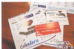
I calendari realizzati da Bcc e Isal